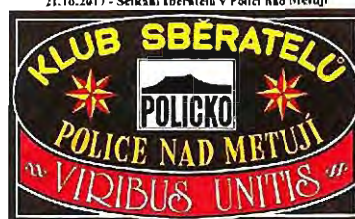
21.10.2017 - Setkání sběratelů v Polici nad Metují