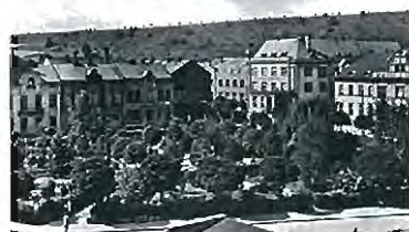
Police nad Metují - Bezdětkovy sady 1935